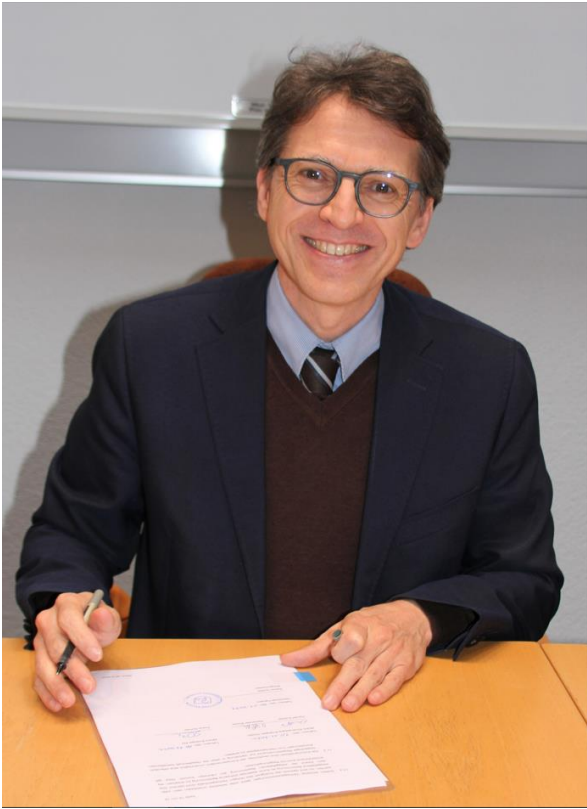
Bürgermeister Rainer Gräßle, Gemeinde Talheim am Neckar